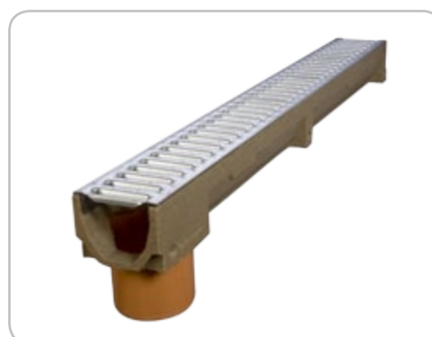
kanał SELF B=100 H=90 z króćcem