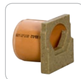
Ścianka czołowa z króćcem