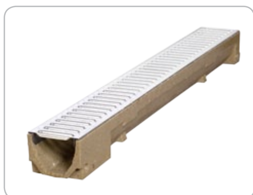
kanał SELF B=100 H=90 standard