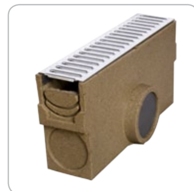
Osadnik + kuweta + ruszt ocynk