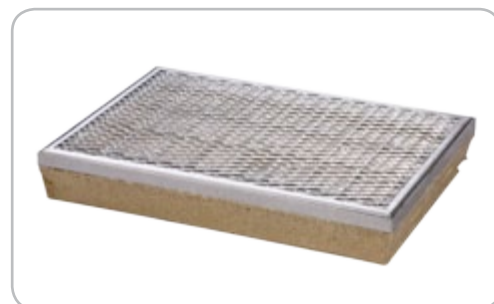
Wycieraczka z rusztem siatkowym