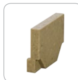
Ścianka czołowa bez wyjścia