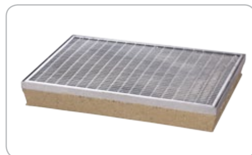
Wycieraczka z rusztem kratowym