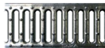
ruszt szczelinowy 10mm ocynk FIX klasa A15